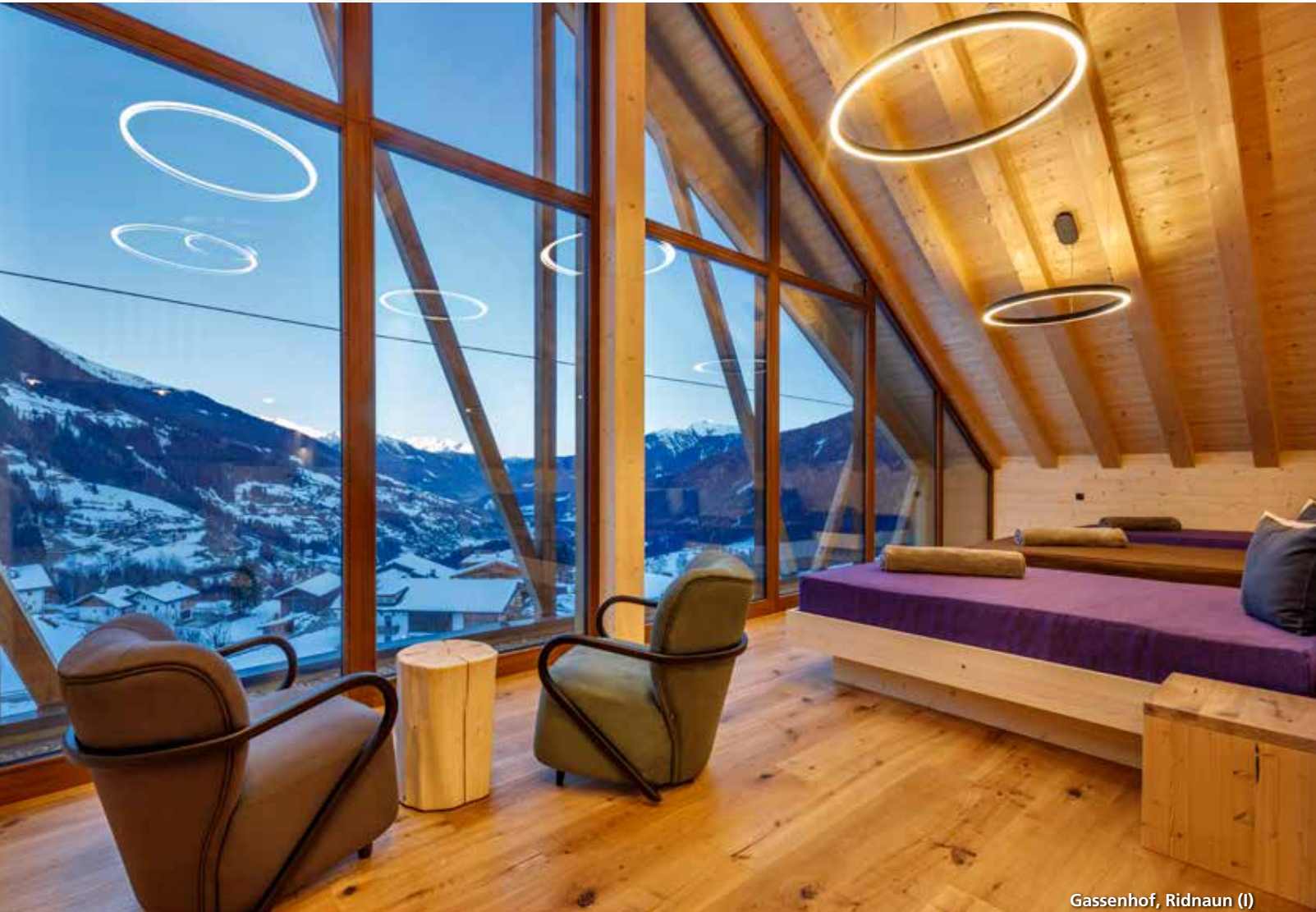
Gassenhof, Ridnaun (I)