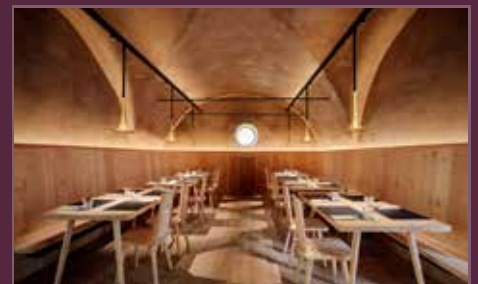
Revitalisierung Historisches Wirtshaus