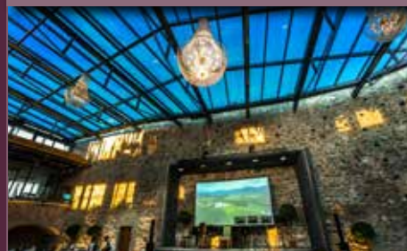
Sanierung Burg Taggenbrunn